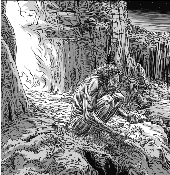
Erstes Feuer des Steinzeitmenschen