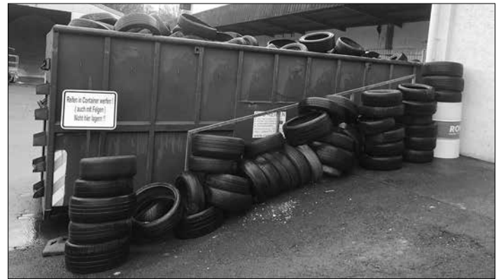
Die im Stadtgebiet illegal entsorgten Altreifen der vergangenen zwei Monate.

tung in diesem Jahr bei der Picobello-Aktion gezeigt haben! Nach dem Frühjahrsputz ist natürlich auch vor dem Frühjahrsputz und daher werden wir gemeinsam das ganze Jahr über daran arbeiten unsere Stadt nachhaltig von illegal abgelegtem Müll zu befreien.“