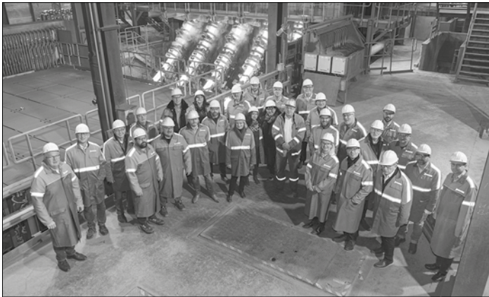
Die Völklinger Unternehmerinnen und Unternehmer bei der Werksführung

Der nächste Unternehmerdialog wird nach der Sommerpause im Herbst 2023 stattfinden. Interessierte Unternehmerinnen und Unternehmer können sich für nähere Informationen an das Referat für Wirtschaft, Stadtmarketing und Tourismus wenden, Telefon 06898 13 2004.