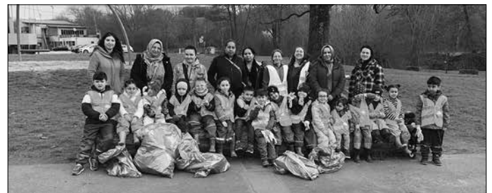
Die Kinder der städtischen KiTa Kunterbunt (Neues Rathaus) haben, unterstützt von begleitenden Müttern und Erzieherinnen, auf dem Spielplatz vor der Hermann-Neuberger-Halle Müll aufgesammelt.